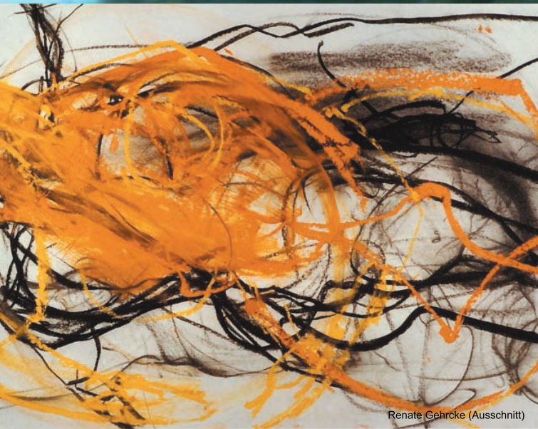
Renate Gehrcke (Ausschnitt)